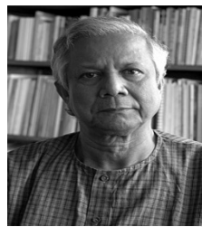
Prof. Muhammed Yunus Nobelova cena