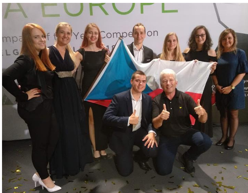
Studentská firma Smesh v doprovodu zástupců organizace Junior Achievement Czech a Citi Foundation.

Letošní nejúspěšnější studentská JA Firma Smesh z Gymnázia Ostrava - Hrabůvka reprezentovala Českou republiku v rámci evropského finále JA Company Of The Year Competition . Prestižní soutěž, na kterou se sjeli úspěšní mladí podnikatelé z celé Evropy, se uskutečnila v srbském Bělehradu ve dnech 16. -19. 7. 2018. Ačkoli se tým Smesh neumístil na stupních vítězů, jeho výkony byly excelentní. Letošní první místo patří britskému týmu SureLight .