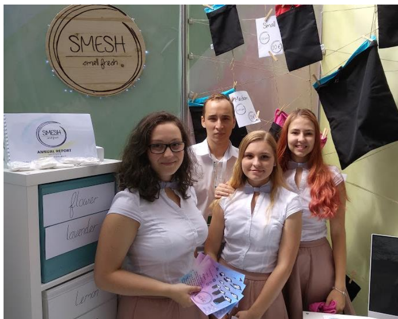
Studentská firma Smesh prezentuje své výrobky ve veletržním stánku v centru Bělehradu.